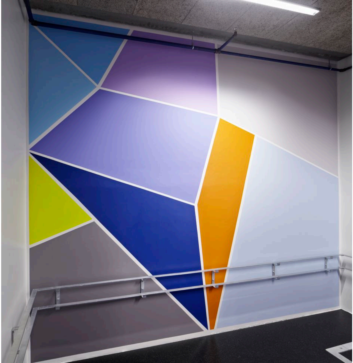
Eksempel: Katrine Giæver Tynset vgs.